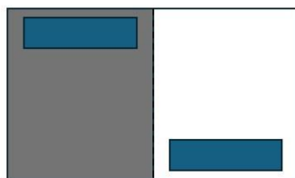
机配置例①（対角線になるように）